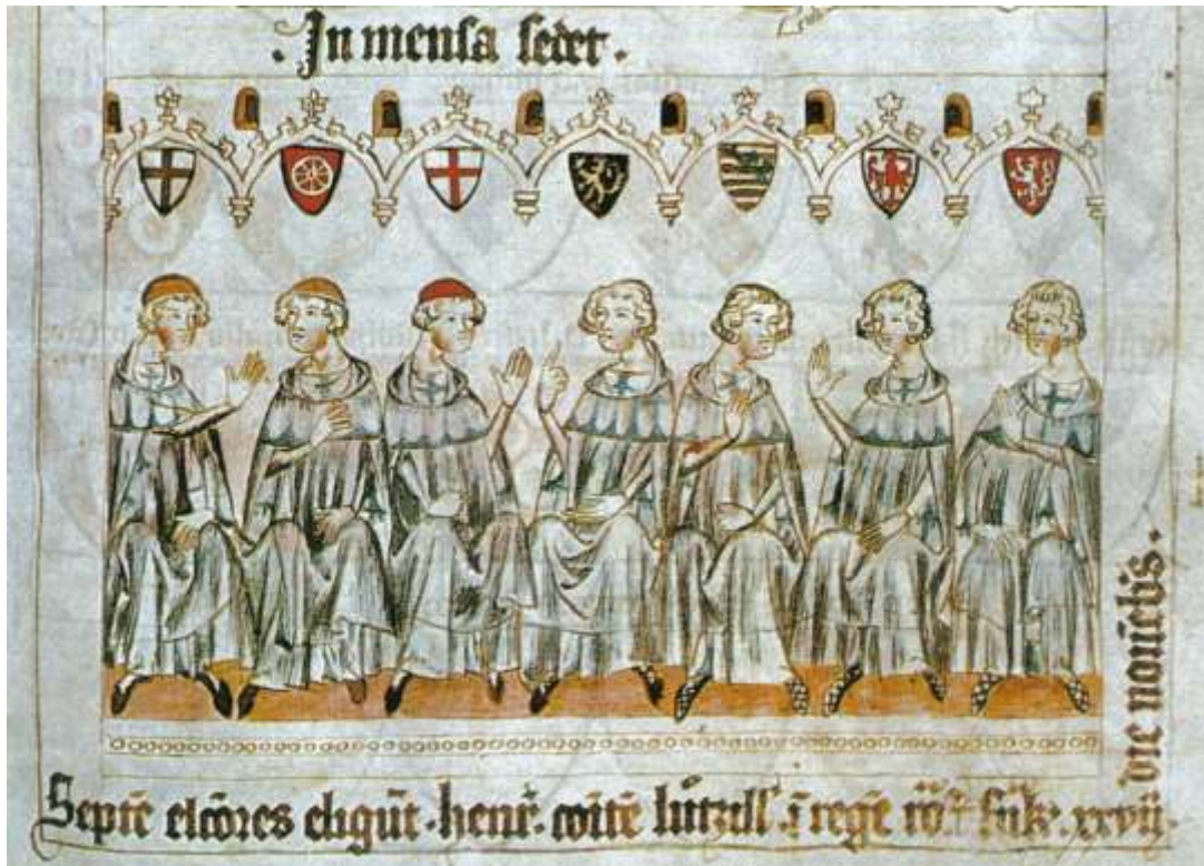
Zvolení Jindřicha VII římským králem. Balduin Lucemburský je třetí zleva

Roku 1308 byl silně krátkozraký a německy špatně hovořící Jindřich zvolen na římský trůn. Volba byla ovlivněna jeho mladším bratrem Balduinem, který byl v tu dobu novopečeným arcibiskupem v Trevíru ( ve svých dvaadvaceti letech) a mohučským arcibiskupem Petrem z Aspeltu, bývalým kancléřem českého krále Václava II.