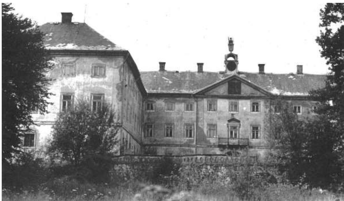
Devadesátá léta pohledem na exteriér budovy

profilací. Světlá výška místností je však značně nižší než u prostor prvního patra, a to i v hlavním sále zámku, který byl kupodivu umístěn až do druhého patra. Vyplňuje celou střední část středního křídla, na obou fasádách ohraničenou rizalitou. Traduje se, že sál měl bohatou štukovou výzdobu stropu – v ornamentu převládali rozviliny a válečné symboly jako meče, brnění, přilby, kopí, prapory atd. připomínající úspěchy stavitele zámku hraběte Salma ve válečném tažení proti Osmanům, ovšem toto tvrzení doposud nebylo potvrzeno ani z průzkumu pozůstatků vlastní místnosti a ani z jakýchkoliv dochovaných archivních materiálů. Krov nad celým tříkřídlým objektem byl původní barokní. Krov byl vaznicové soustavy se dvěma vaznicemi, hambalkový, s ležatou stolicí vyztuženou vzpěrami. Stavebně historická analýza prokázala, že architektura zámku je jednotné barokní koncepce. Pozdější je pouze portál orientovaný do čestného dvora, pocházející z období rekonstrukce zámku, tedy z roku 1848. Ostatní stavební změny v budově (příčky, některé zadržky dveří a oken) jsou novějšího data a jsou svým charakterem bezvýznamné. Čtenář si jistě povšiml, že většina informací je podávána v minulém čase, neboli dnes již neexistuje. Přesto se současný majitel zámku chce pokusit o plnou rehabilitaci tohoto objektu a následně jej zpřístupnit veřejnosti tak, jak se to stalo v případě zámku ve Šluknově, který byl v podobném stavu ještě nedávno.