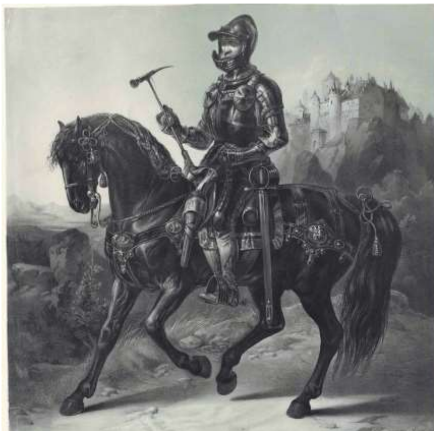
Nikolaus von Salm

panství Salmhof u Vídně poté, co především jeho zásluhou byla Vídeň zachráněna před islámskými agresory. Císař Karel V. mu z vděčnosti nechal ve Vídni vybudovat pomník, na němž byly zachyceny všechny jeho bitvy a panovníci, jimž sloužil.