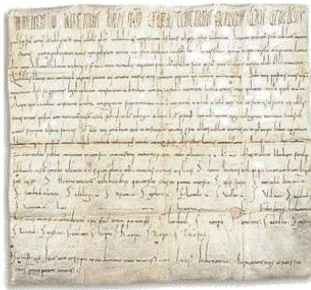
Zakládací listina Lucemburku z roku 963

Se svojí chotí měl devět dětí, z nichž třetí narozený, Giselbert (?997/1007-1059), hrabě ze Salmu, Longwy a Lucemburku je dalším pokračovatelem rodu. Fridrich I. zemřel roku 1019 na hradě Salm v lucemburském hrabství. Tento údaj je také první zmínkou o místě, které dalo později jméno celému rodu. V okolí hradu se těžilo zlato již v pátém století před Kristem a pozdější dolování dalo základ ekonomické prosperitě celé oblasti. Dnešní ruiny hradu Salm však pocházejí až z pozdější doby. Nový hrad po rozšíření panství se zdejší aristokracie rozhodla postavit až v roce 1307, dokončen pak byl v roce 1362. Jestli bylo místo dnešního hradu osídleno před těmito daty, není ale dnes jisté. Jisté je, že po dokončení hradu hraběnka Mahaux, manželka Jindřicha VI. Salma se velmi snažila, aby v podhradí vzniklo prosperující město a nově příchozí obyvatelé získali značné výhody. Přesto byl hrad vystaven v průběhu staletí mnoha ničujícím epizodám, mnohokrát vyhořel, byl poškozen v mnoha válečných konfliktech, a přesto stále znovu obnovován. Poslední úpravy hradu jsou datovány k roku 1752. Již ale v roce 1788 je hrad prakticky v troskách, které naposledy demoluje osvobozující americká armáda v roce 1945.