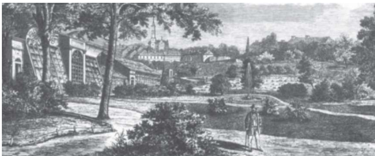
Zahrada české společnosti pro zvelebování zahradnictví v Praze (dnešní botanická zahrada na Slupi), 1860

V této souvislosti se zdá velmi pravděpodobné, že starohrabě Salm udržoval těsné a inspirativní vztahy se svým vzdáleným příbuzným a vynikajícím neprofesionálním botanikem své doby, knížetem Josefem Salm-Reifferscheidtem-Dyckem. Ten angažoval za účelem znovuzaložení a přebudování zámeckého parku u zámku Dyck věhlasného skotského zahradního architekta Thomase Blaikieho (1751-1838), realizátora významných evropských zahrad ve stylu anglicko – čínského módního stylu. Tento architekt spolupracoval s dalším významným architektem, Maximilianem Friedrichem Weyhem (1775-1846), významným německým klasicistním krajinným architektem, který pro Salmy koncipoval zámecký park na zámku Anholt.