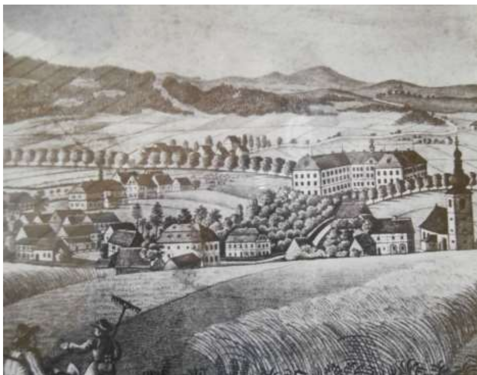
Dobový pohled na zámek a městečko Hainespach