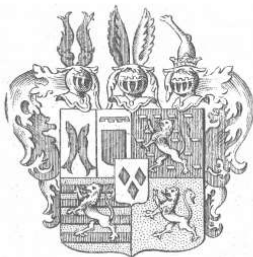
Erb Leopolda Antona starohraběte ze Salmu - Reifferscheidtu