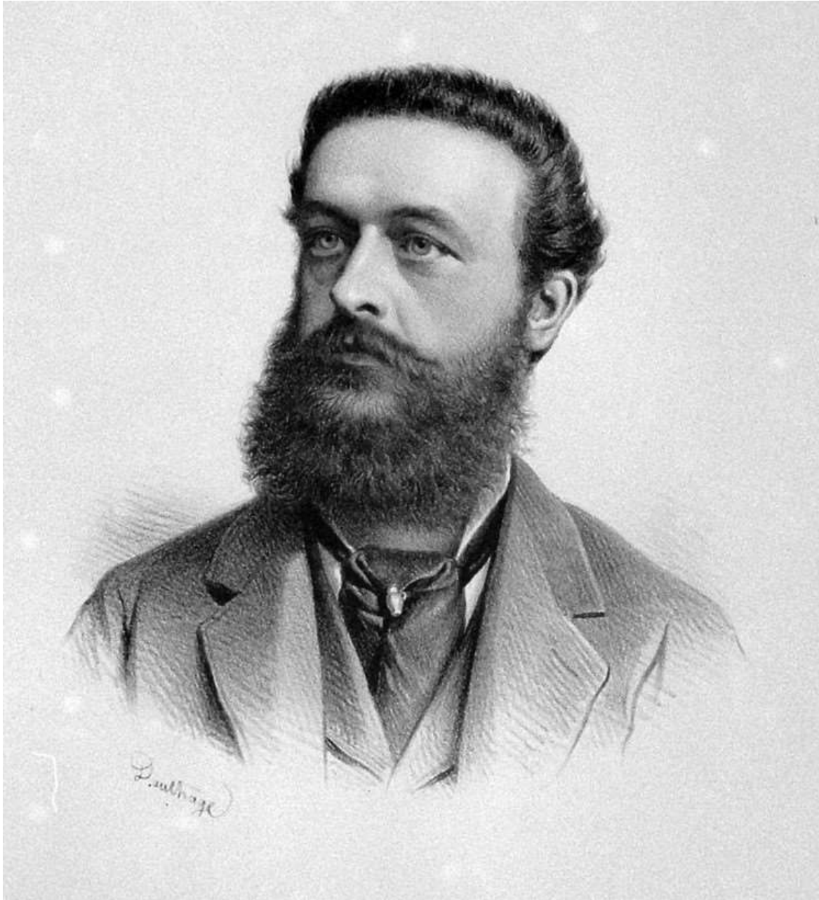
Josef Osvald II. z Thun-Hohensteinu (1849–1913), starosta v Klášterci nad Ohří, člen Panské sněmovny, rytíř Řádu zlatého rouna