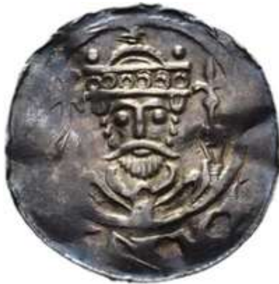
Hermann I. ze Salmu, vzdorokrál římský na dobové minci

roku 1086 císaře u Bleichfeldu nad Mohanem a získal Würzburg, nicméně jeho vliv však zůstal omezený. Unavený svou rolí stínového krále, se v roce 1088 stáhl do svých dědičných zemí a téhož roku přišel o život v bitvě o Cochem. S manželkou Sophií von Formbach, dcerou hraběte Meginharda V. z Formbachu měl tyto děti: Hermanna II. von Salm, Otto I. von Salm a Dietricha von Salm. Hermann I. zemřel roku 1088 ve věřavě válčné a Sofie von Formbach se po smrti manžela Hermanna I. znovu provdala, a tak skončila jedna z nejvýznamnějších etap rodu hrabat ze Salmu. Pro dějiny Svaté říše římské to byla jen nevýrazná epizoda, ale dějiny se mohly ubírat i značně jinak. Jen pravděpodobně hvězdy nebyly nakloněny tím správným směrem. Ale jen nemnoho aristokratických rodů evropských se mohlo chlubit do této doby předky, kteří se honosili císařskou korunou a jejichž počátky jsou spojovány s legendárním rodem mocných Karlovců.