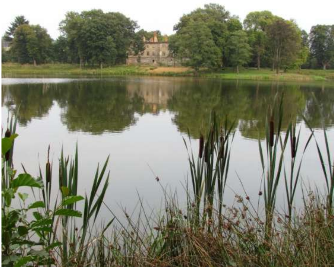
Zámecký rybník, založený Janem Jiřím Slawatou v letech 1675–1677