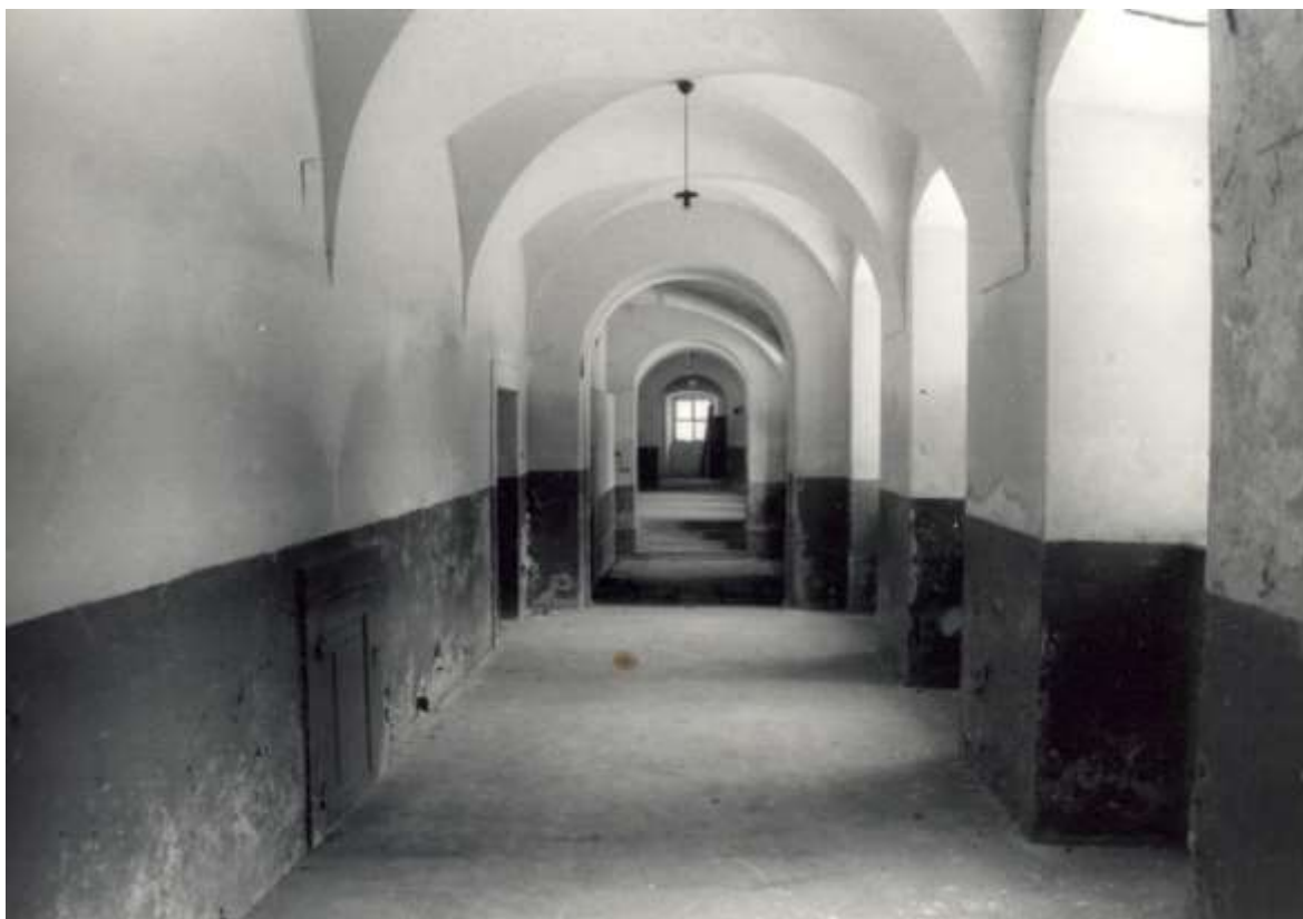
Fotografie znázorňuje spojovací chodbu zámku ze sedmdesátých let minulého století