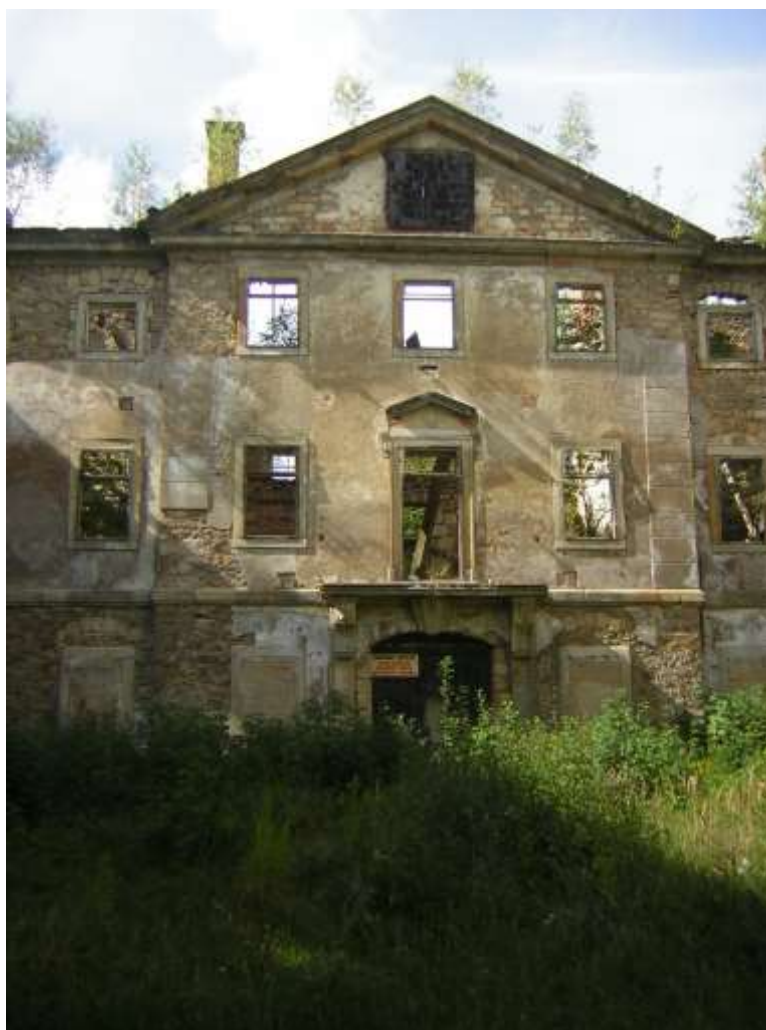
POČÁTEK NOVÉHO TISÍCLETÍ JIŽ UKAZUJE ZÁMEK JAKO RUINU

Zámecký areál se skládá z vlastní budovy zámku a ze zámeckého parku, přičemž celý komplex je památkově chráněn, momentálně je zařazen na seznam nejohroženějších nemovitých kulturních památek ČR. Projekt současné obnovy zámku předpokládá takové využití, které upřednostňuje veřejné zájmy, vzhledem k možnostem, které stavba zámku umožňuje. Cílem projektu je tedy zpřístupnit veřejnosti většinu podlahové plochy zámku s tím, že zde bude průběžně návštěvník seznamován prostřednictvím aktualizovaných expozicí s dějinami místa a regionu v celoevropských souvislostech. Zásadním pozitivem tohoto projektu je jeho společenský přínos, záchrana významné nemovité kulturní památky, jejíž význam pro region je zásadní.