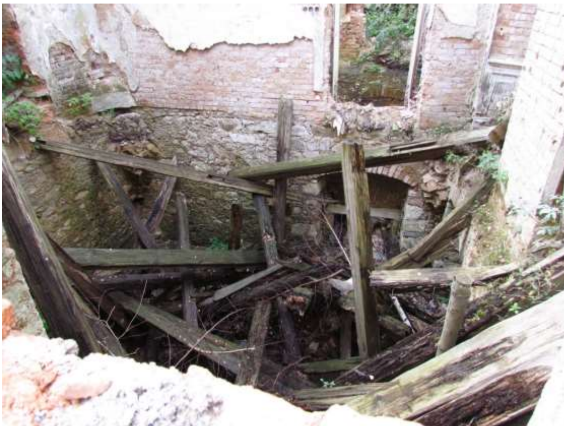
FOTOGRAFIE INTERIÉRU STŘEDNÍHO KŘÍDLA Z ROKU 2010